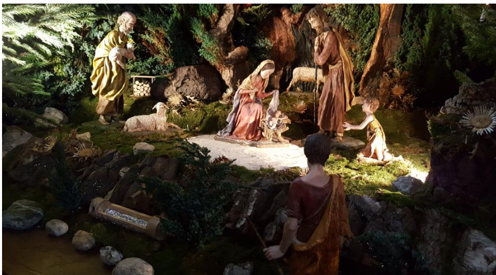
Weihnachtskrippe in St. Laurentius Kleinsassen